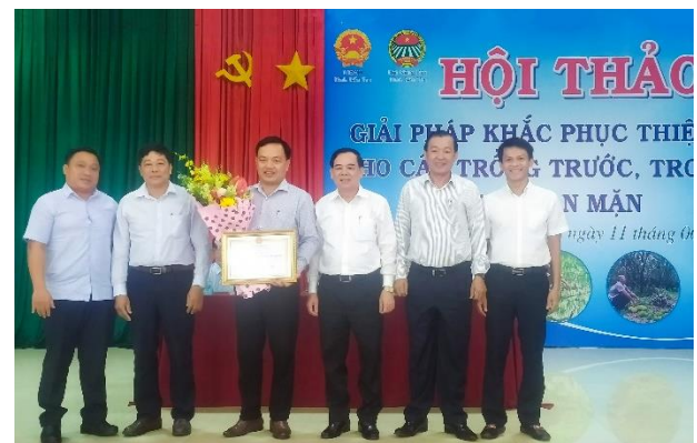
Ghi nhận công lao và thành tích xuất sắc trong khắc phục hạn mặn, UBND Tỉnh Bến Tre đã tặng Bằng khen cho Ban Lãnh đạo công ty BIWASE.

● Ngày 23/05, Ban chấp hành Đảng bộ công ty BIWASE đã tổ chức Đại hội Đại biểu Đảng bộ lần thứ X - nhiệm kỳ 2020-2025. Có 120 đại biểu, đại diện cho 208 đảng viên/1.110 CBCNV từ 13 chi bộ về dự.