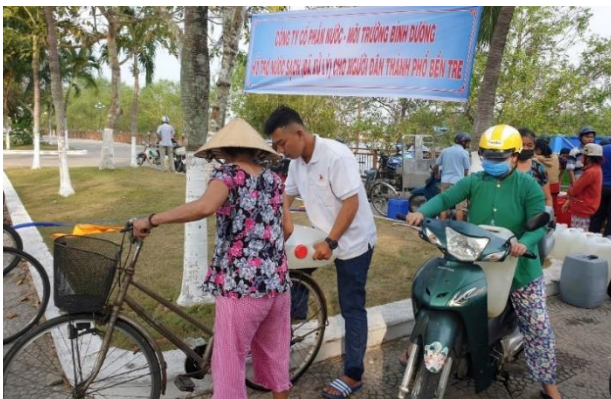
Nhân viên BIWASE hỗ trợ người dân Bến Tre chở nước về nhà

Từ cuối tháng 3/2020, BIWASE đã tổ chức nhiều chuyến sà lan vận chuyển nước sạch từ TP.Thủ Dầu Một, Bình Dương về tỉnh Bến Tre hỗ trợ người dân đang gồng mình trước nắng hạn kéo dài và nước nhiễm mặn lấn sâu ra toàn tỉnh. Độ mặn lúc cao điểm lên đến 17‰ tại thành phố Bến Tre. Người dân Bến Tre rất vui mừng, biết ơn Công ty BIWASE đã mang nguồn nước sạch, mát lành về giải khát, giải mặn kịp thời.