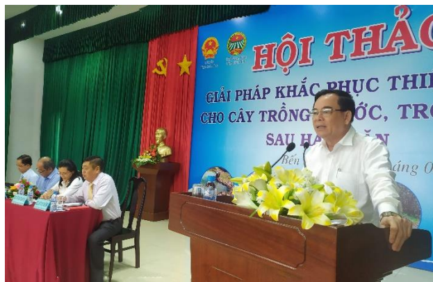
Ông Huỳnh Ngọc Tam - Phó Bí thư thường trực Tỉnh ủy Bến Tre phát biểu kết luận hội thảo

Đánh giá cao nội dung và kết quả hội thảo, ông Trần Ngọc Tam, Phó Bí thư thường trực Tỉnh Ủy Bến Tre kết luận: “Để việc hỗ trợ nông dân mang lại hiệu quả thiết thực Tỉnh Ủy – UBND tỉnh Bến Tre sẽ có văn bản chính thức kiến nghị Chính Phủ, các bộ ngành sớm có chính sách miễn giảm thuế cho một số loại phân bón phục vụ chương trình Nông nghiệp Hữu cơ nhằm giảm giá thành; Có gói cho vay hỗ trợ, miễn giảm thuế cho doanh nghiệp sản xuất phân bón để doanh nghiệp có điều kiện hỗ trợ nông dân; Nông dân được tiếp cận nguồn vốn ưu đãi để chủ động phương án sản xuất, thích ứng với điều kiện biến đổi khí hậu...”.